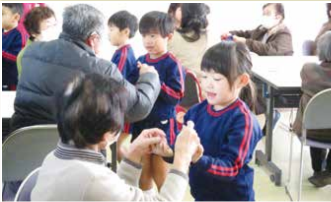
地区福祉推進委員会活動（シニアふれあいのつどい）