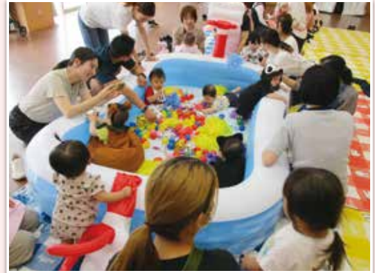
育児ファミリーサポートセンター事業（交流会）