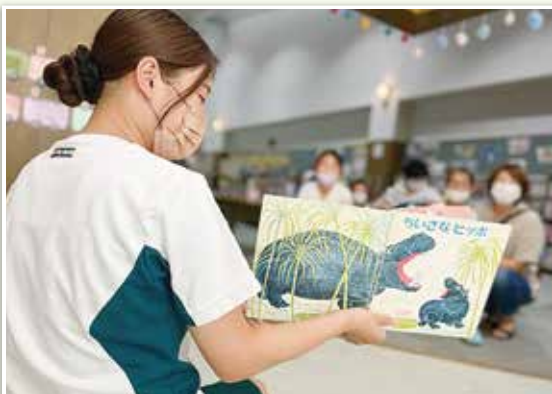
サマーボランティア体験事業